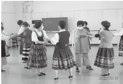
柳井市老人クラブ連合会