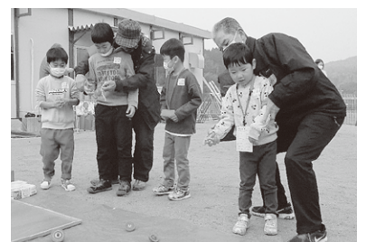
昔の遊びを楽しもう 日積地区社会福祉協議会