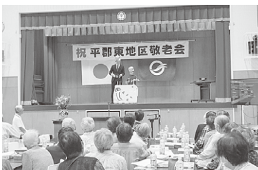
◆平郡東地区 10月2日(月)◆