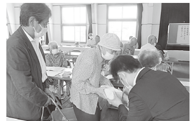
◆平郡西地区 10月2日(月)◆