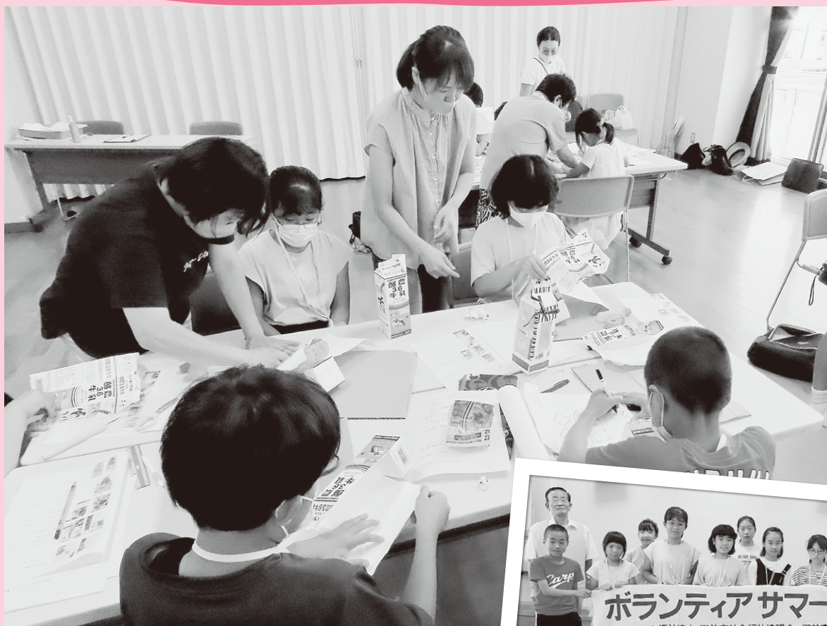
●SDGsに貢献！紙パックでランタンづくり