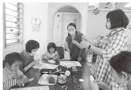
第1回おしゃべりサロン 5月17日（水） ・組ひもでアクセサリを作ろう