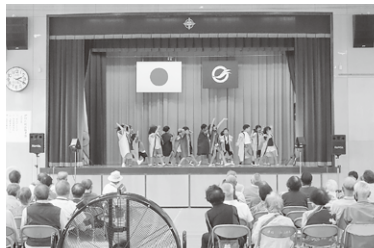
◆伊保庄地区 9月19日(火)◆