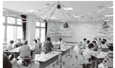
はーとふる♡サロンの様子

災害罹災者への見舞金贈呈 地区の福祉講演会等開催の支援 福祉員活動への支援 災害対策支援事業 福祉機器(車いす)整備、福祉車両整備事業 福祉無料法律相談所の開設 超初心者向けスマホ講座の開催 等