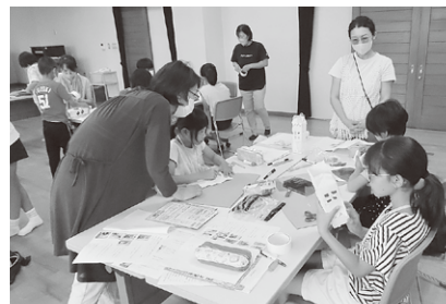
おしゃべりにSDGsに貢献