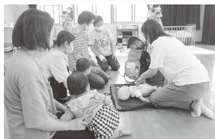
第1回講習会 6月14日（水） ・乳幼児と児童に対する救急法指導