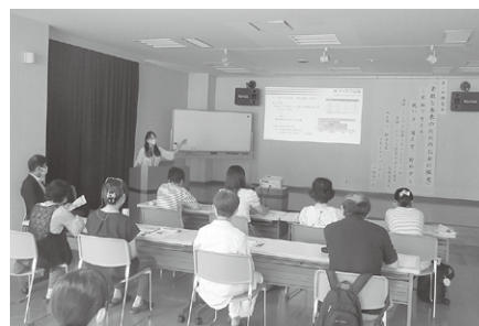
第2回講習会 9月13日（水） ・これからのマネープラン