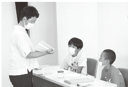
点字を打ってみましょう