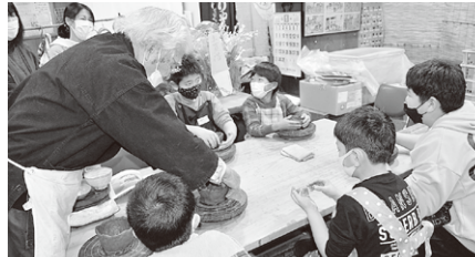
柳井市子ども会育成連絡協議会

市県民税非課税世帯児童生徒の入進学祝金贈呈 育児支援事業 子どもの学習支援活動の支援 保護司会活動支援 等