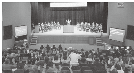
耳の日記念山口県大会／柳井ろうあ協会