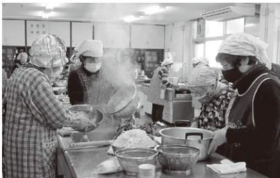
柳井市老人クラブ連合会 / 健康料理教室