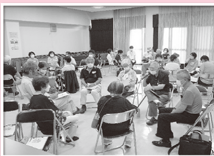
◆中央・柳井津地区