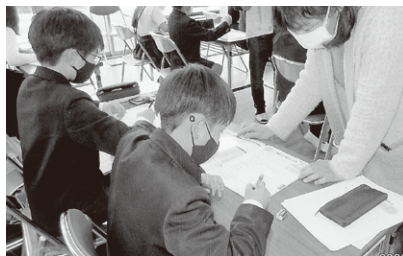
花育の会 / 学習支援活動