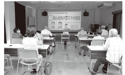
超初心者スマホ講座