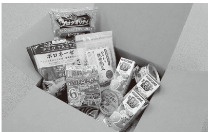
ひとり親家庭への食料支援