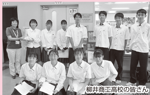
柳井商工高校の皆さん