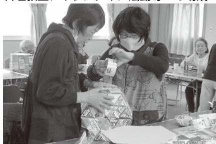
柳井市老人クラブ連合会 / ボランティア活動