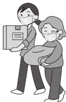
支援物資の仕分け