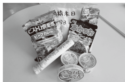
生活困窮者への食糧支援

災害罹災者への見舞金贈呈 地域の福祉講演会開催の支援 福祉員活動への支援、災害対策支援事業 福祉機器（車いす）、福祉車両整備事業 いきいきサロン活動への支援 等