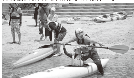
柳井市子ども育成連絡協議会 / カヌー体験

市県民税非課税世帯児童生徒の入進学祝金贈呈 子ども会活動への支援 育児支援事業（絵本の読み聞かせ） 子どもの学習支援活動 保育協会柳井支部研修事業助成 等