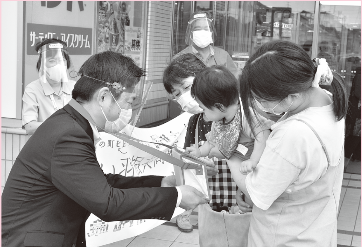
●赤い羽根共同募金運動開始 街頭募金活動(令和3年10月1日)