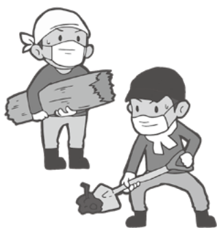
土砂のかきだし、運搬など

登録を希望される場合は事務局で直接登録するか、本会ホームページから申込書をダウンロードし、必要事項を記入の上、郵送してください。