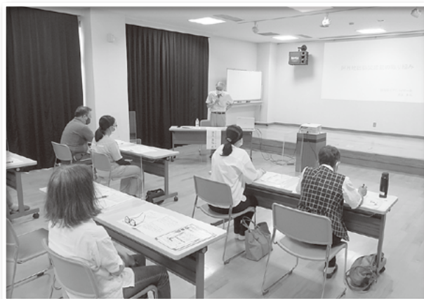
防災組織結成・活性化に取り組んでおられます。