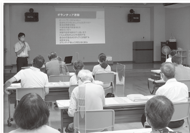
被災地での活動を教えていただきました。