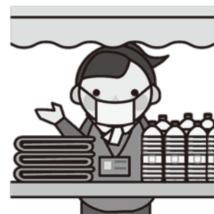
支援物資のお渡し

※ 必ずボランティアに参加していただくものではありません。日時やボランティア内容も様々ですので、無理のない範囲でご協力ください。