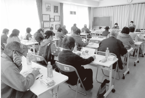
阿月地区サポーター研修会

本会は日常生活の中でのちょっとした困りごとを、ご近所同士で助け合う仕組みづくりに取り組んでいます。この仕組みは、困っている人から相談を受ける「生活支援コーディネーター」と、地域の困りごとについて話し合う場の「協議体」、実際に困っている人を助ける「サポーター」という3者から成り立っています。現在、市内各地区で困りごとを把握し、地域関係者の皆様と協議しながら全地区でこの仕組みができるように取り組んでおります。ご協力の程よろしくをお願いいたします。