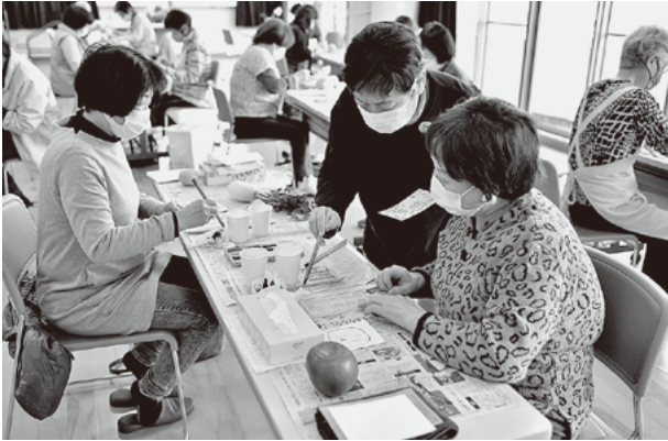
色を塗る時は、ポンポンとリズムカルに。

外出を控えたり多くの人が集まる行事が減ったりする中、人と人とのつながりを大切にしたいと多くの人を感じています。柳井市社会福祉協議会では、市内の80歳以上のひとり暮らしの方へ『季節のお便り』として、絵手紙ボランティアの皆さんが描かれたハガキをお届けしています。このボランティア活動を拡充する目的で絵手紙の体験講座を令和3年3月11日に開催し、19名の参加者がありました。