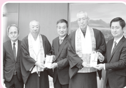
柳井市広域仏教会 ボーイスカウト柳井第三団