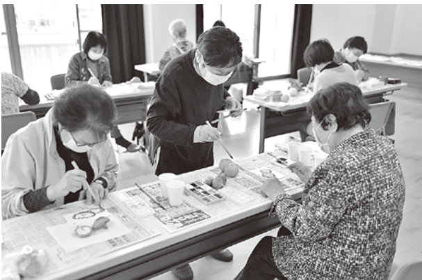
「元気の出るような色にしましょう」