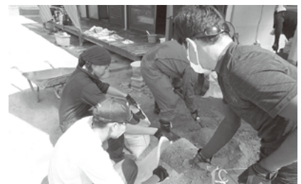
災害ボランティア活動

生活交通手段の確保については、地域内交通の取り組み支援として、実証実験に協力し、地区社会福祉協議会へ車両の貸出を行っています。