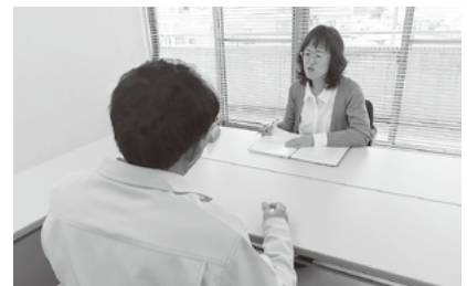
福祉無料法律相談

生活困窮者自立支援の体制整備づくりでは、新たに米や缶詰などの食糧支援や、食事の提供や学習支援など子どもの居場所づくりのコーディネートも行っています。また、住民共助の役割を担う有料在宅福祉サービス事業の推進に努めています。