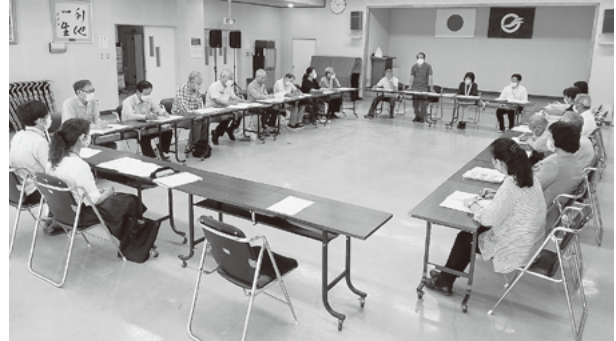
柳東地区生活支援協議会（協議体）