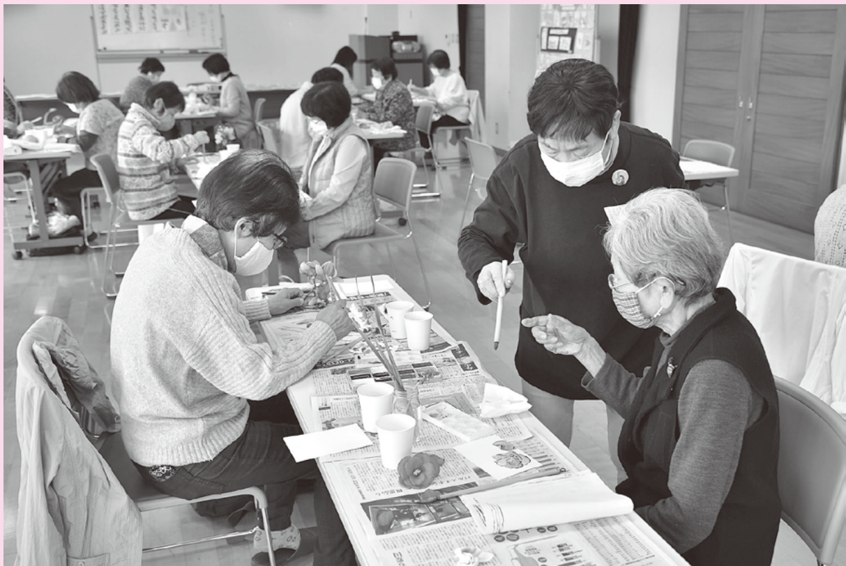
ヘタでいい、ヘタがいい。やさしい「えはがき」、えがきます。 (ボランティア体験講座)