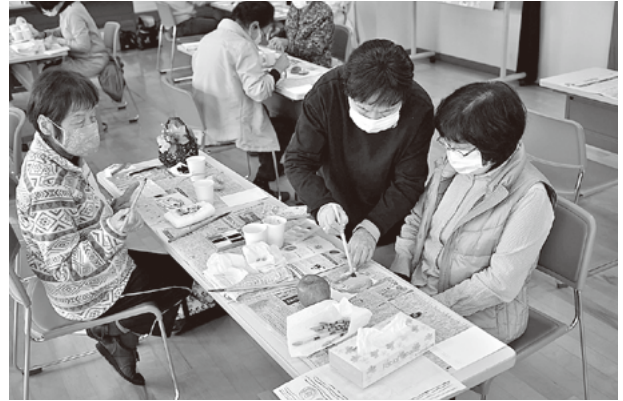
光っている部分は、色を塗らず立体的に。