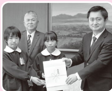
柳井市子ども会育成連絡協議会