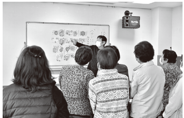
初めての作品は、どれも素敵な味わいに。