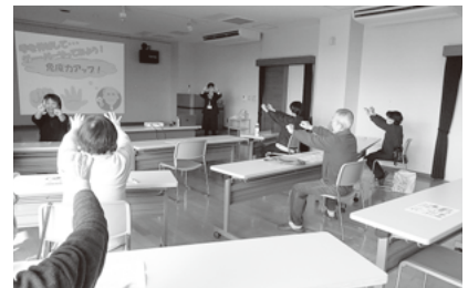
有料在宅福祉サービス研修会

福祉の市やボランティアまつりを通して福祉の意識啓発を図り、小中学校への職員派遣によるボランティア学習指導やボランティア体験を通して福祉教育を推進することができました。今後も若い世代への福祉教育を継続していく必要があります。