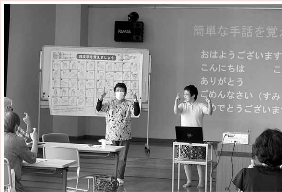
はーとふるサロン（市社協OB会）