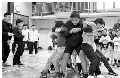
柳井地区社会福祉協議会柳井支部会

地域住民が持ち寄ったしめ飾りを焼いて一年間の無病息災を願うとともに、おしくらまんじゅう大会を実施し、地域住民相互の交流が図れました。