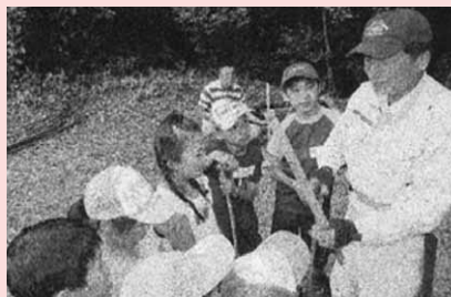
柳井市子ども会育成連絡協議会 / 野外活動 竹細工で自分で遊ぶための道具を作り、 レクリエーション活動をしました。

市県民税非課税世帯児童生徒の 入進学祝金贈呈 子ども会活動への支援 育児支援事業（絵本の読み聞かせ） 子どもの学習支援活動 保育協会柳井支部研修事業助成 等