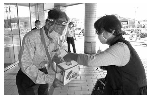
運営委員さんのご協力により街頭募金を実施しました。45,858円の募金が集まりました。ありがとうございました。