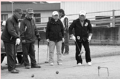
柳井市老人クラブ連合会 / スポーツ大会 相互の親睦と交流を図ることができました。