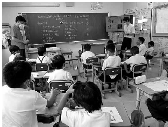
令和2年9月4日に伊陸小学校にて地域の高齢者を見守る活動についての講座を実施しました。

柳井市社協では手話講座、高齢者疑似体験、車いす体験等の「福祉の出前講座」をしています。市内の学校やサロン、自治会にお伺いします。詳しくは柳井市社協までお尋ねください。