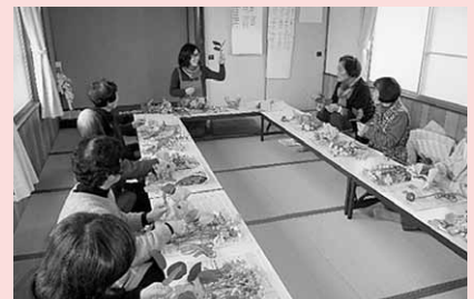
余田地区社会福祉協議会 / ふれあい交流事業

災害罹災者への見舞金贈呈 地域の福祉講演会開催の支援 福祉員活動への支援、災害対策支援事業 福祉機器（車いす）、福祉車両整備事業 いきいきサロン活動への支援 等