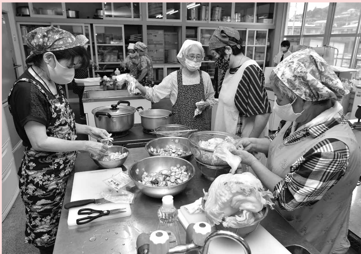
●老人給食(柳井市地域見守型配食サービス)を再開しました。